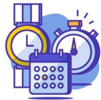
آنالیز و برنامه‌ریزی

با یک نگاه جامع می‌توان گفت برای تعیین رتبه یک صفحه در نتایج جستجو بیش از 200 فاکتور مختلف توسط ربات‌های گوگل بررسی می‌شوند. ولی می‌توان این موارد را به 5 دسته اصلی تقسیم کرد: